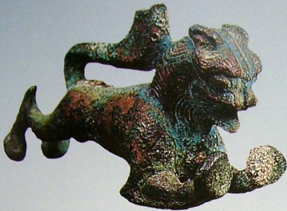
铜狮 唐 长9.9厘米,宽3.1厘米,高5.6厘米 吉木萨尔县北庭故城出土

Copper lion, Tang Dynasty, length:9.9cm, width:3.1cm, height:5.6cm, unearthed from Beiting Ancient City, Jimsar County.