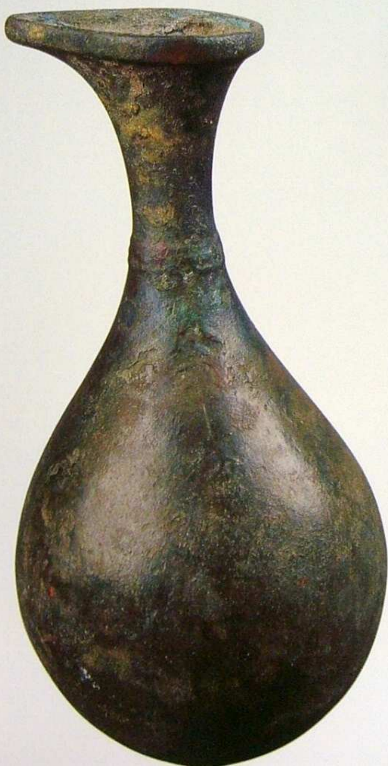
鸭嘴铜壶 宋 通高25.7厘米 巴楚县托库孜萨来遗址采集

Copper oil lamp, Tang Dynasty, length:10.4cm, height:9.8cm, width:7cm, unearthed from Tokuz Saray ruins, Bachu County.