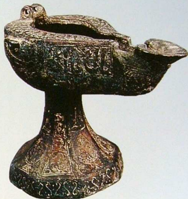
铜油灯 唐 长10.4厘米,高9.8厘米,宽7厘米 巴楚县托库孜萨来遗址出土

Copper lion, Tang Dynasty, length:9.9cm, width:3.1cm, height:5.6cm, unearthed from Beiting Ancient City, Jimsar County.