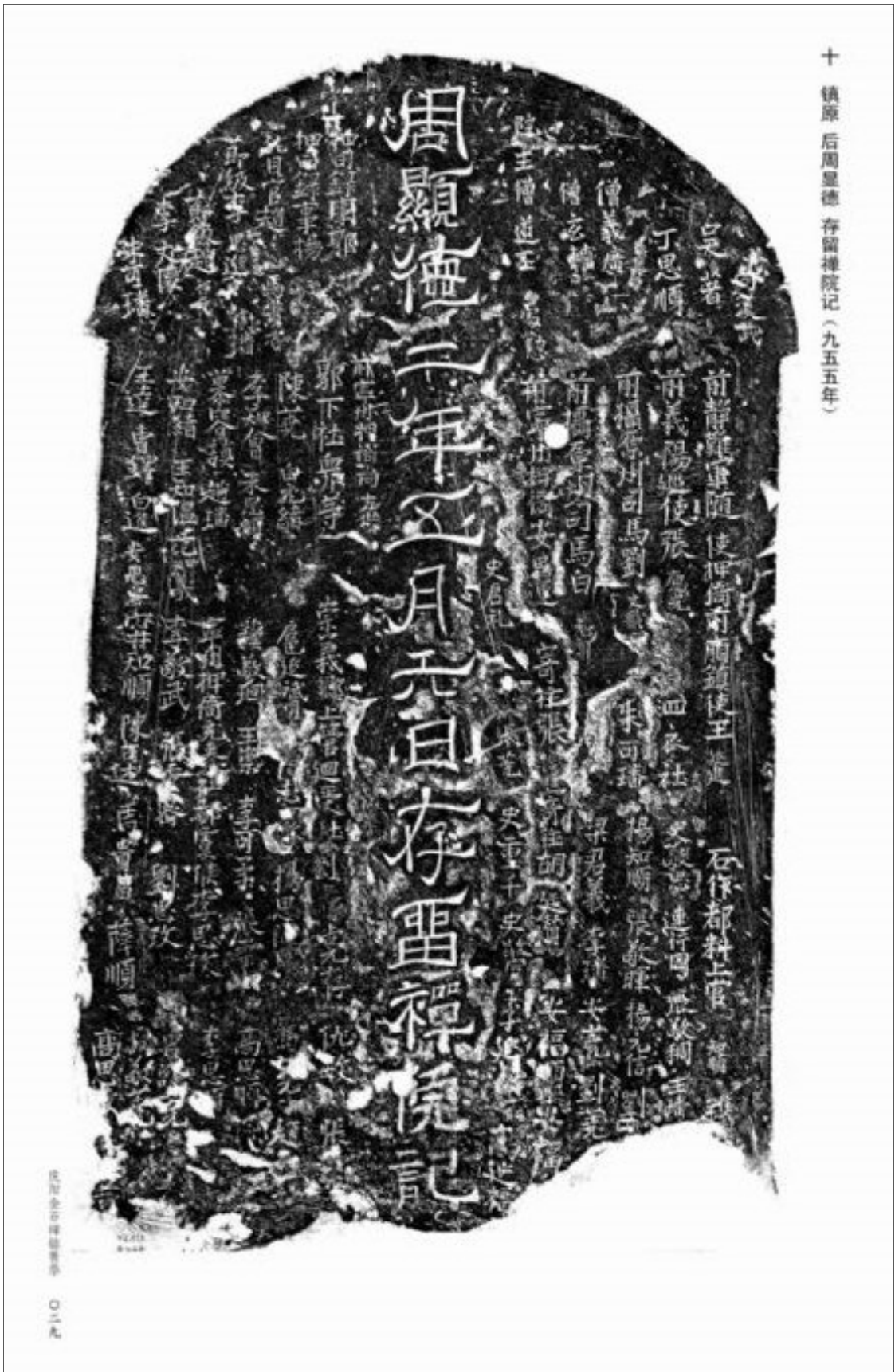
十 镇廓 后周显德 存留禪院记 (九五五年)