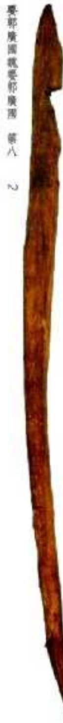
要鄂廣國魏要鄂廣國 第八 二