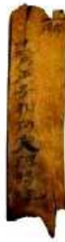
一 十二月庚子朔丙寅備將軍 三