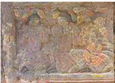
石椁南壁浮雕局部

為配合西安市中級人民法院基建工程，6—8月，西安市文物保護考古所對北周史君墓進行了考古發掘。北周史君墓位於今西安市未央區中明宮鄉井上村東，西距漢長安城 5.7 公裡，距北周安伽墓約 2.2 公裡。墓中出土了石門、石槨和石榻，這些石刻均採用浮雕彩繪貼金，經初步觀察，圖像內容涉及漢文化、禩教和佛教等，內容豐富，內涵深刻。據石槨上的題刻記載墓主為北周史國薩保。 這一發現是繼安伽墓、虞弘墓後國內有關中西方文化交流的又一重要發現。