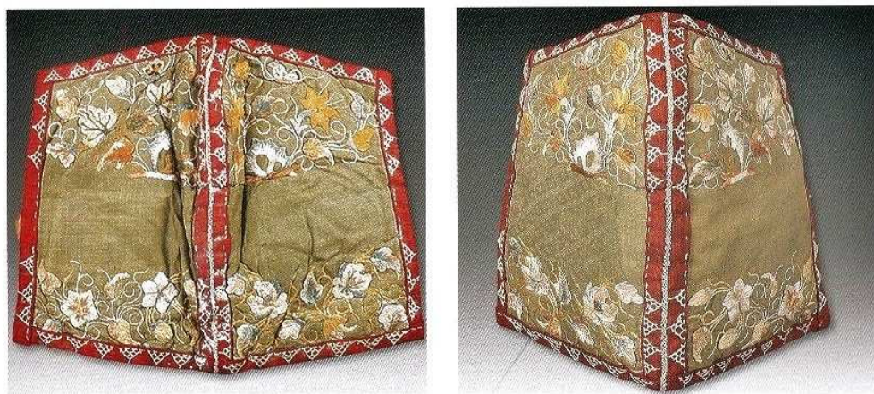
图五 绿暗花绫彩绣花蝶护膝（修复前、后）正面对比

衬里清洗完成，经整形、内絮物填充、缝合、整理绣线等技术手段修复完成，这里不赘述。修复前后对比见图五~八。