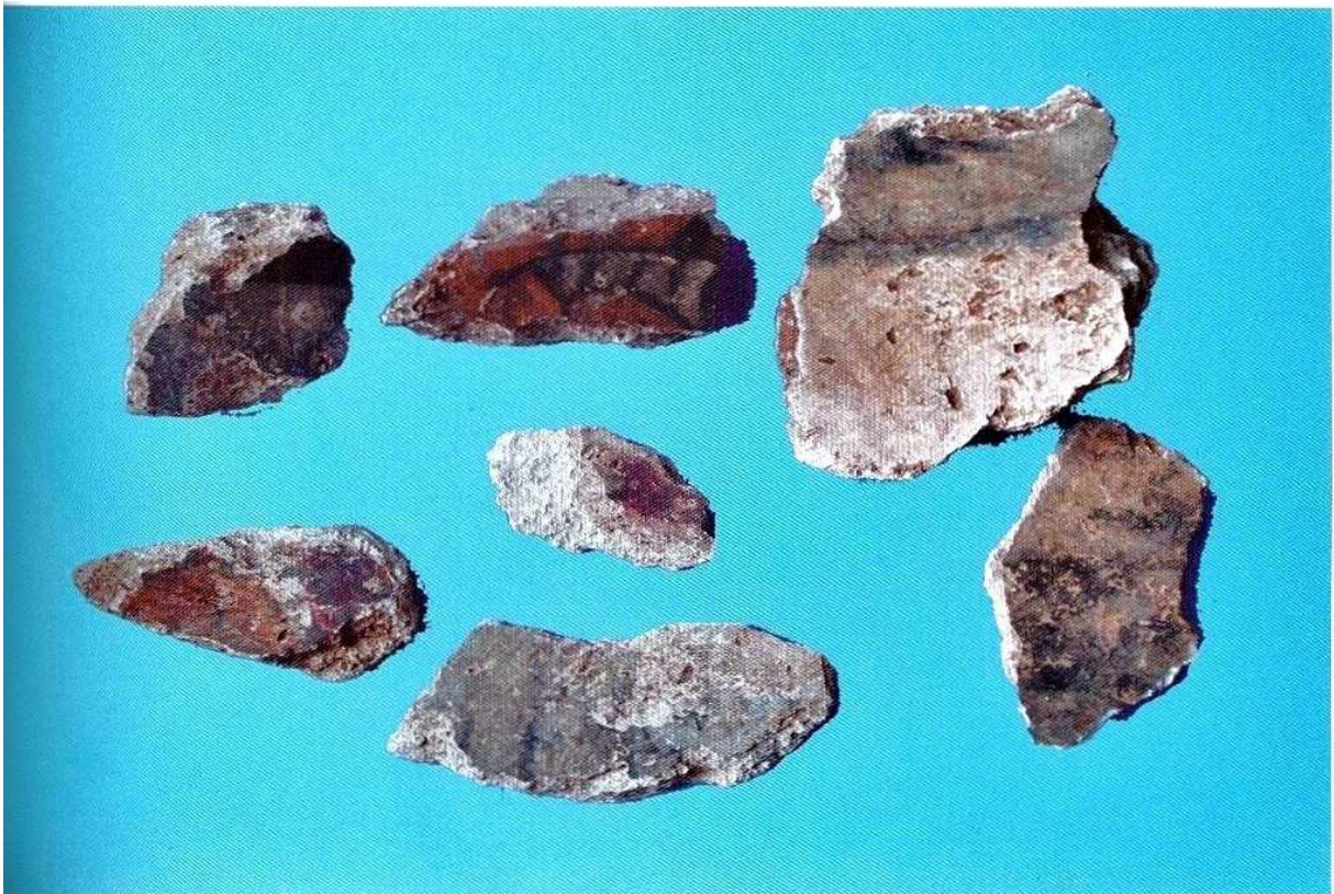
图版一〇七 清理玉桃里壁画墓后室西壁过程中发现的壁画残块（3）