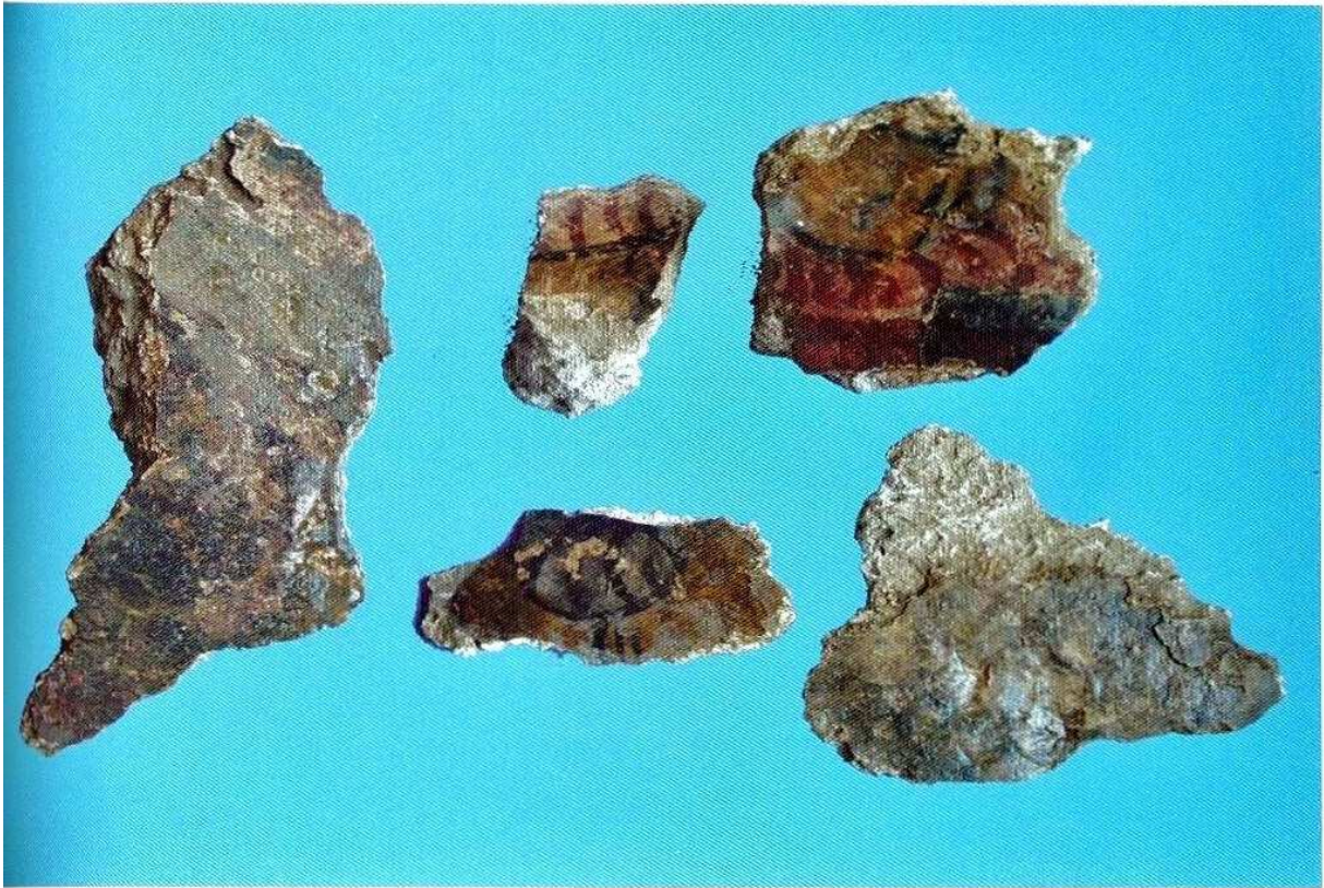
图版一〇六 清理玉桃里壁画墓后室西壁过程中发现的壁画残块（2）