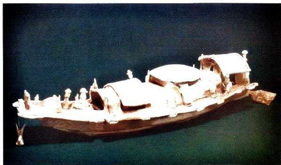
3. 广州东汉陶船模型