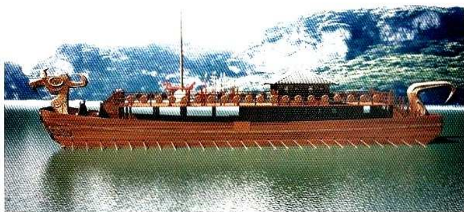
2. 吴国王舟舳舻造型效果图之一