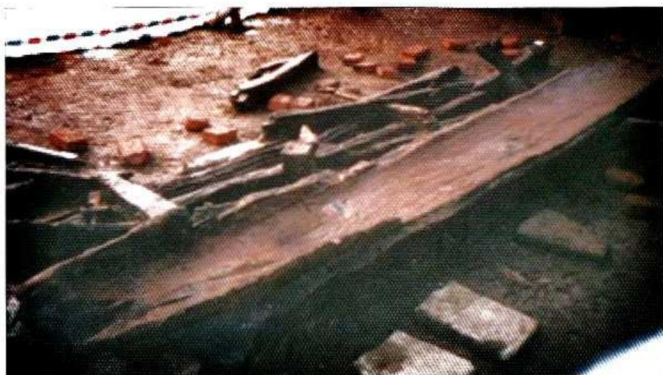
1. 跨湖桥8000年前独木舟