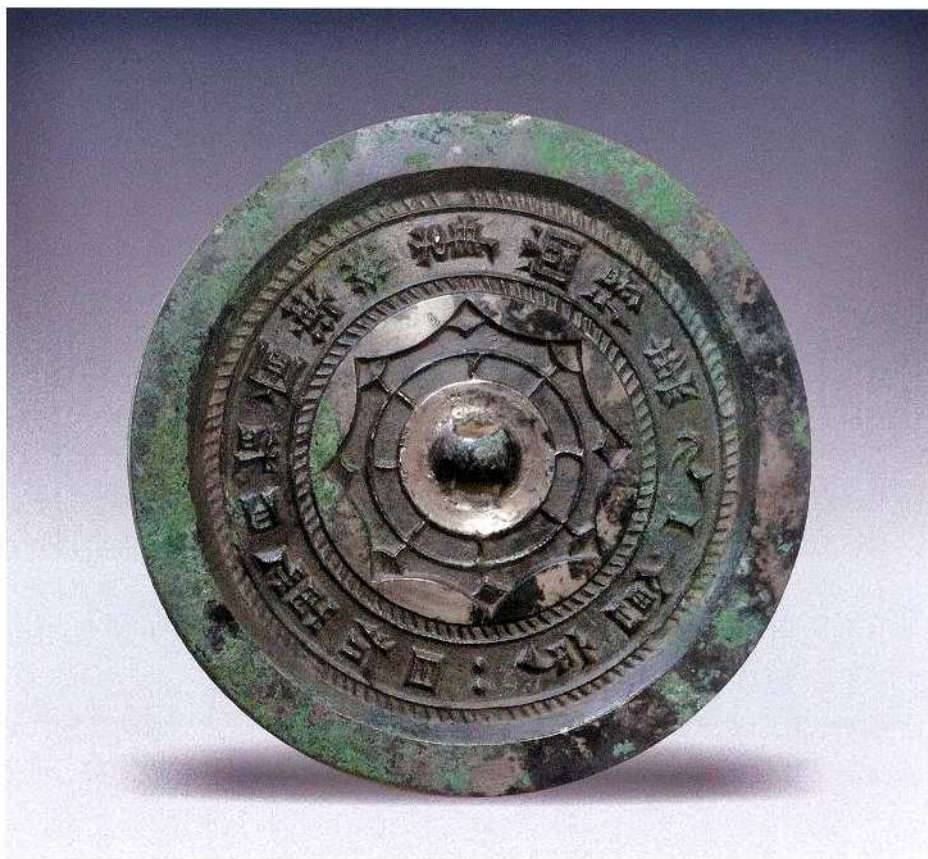
(图16) 西汉日有熹得美人铭文镜