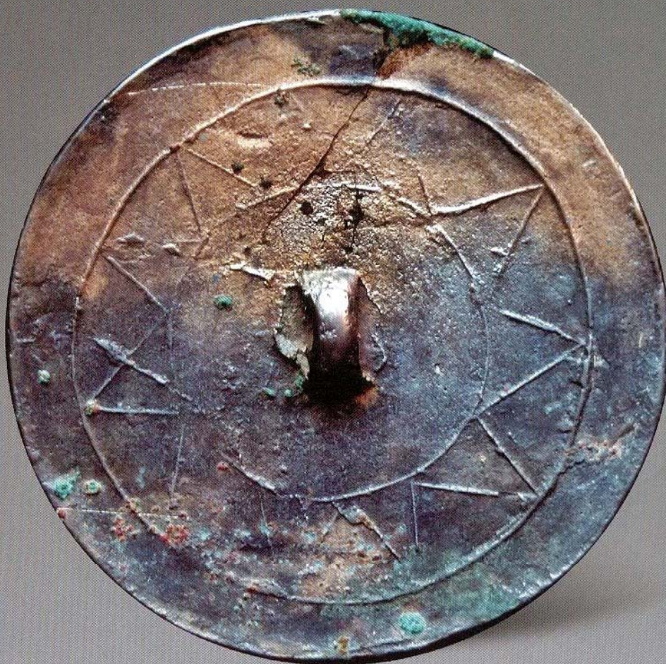
图1 夏商 十角星纹镜