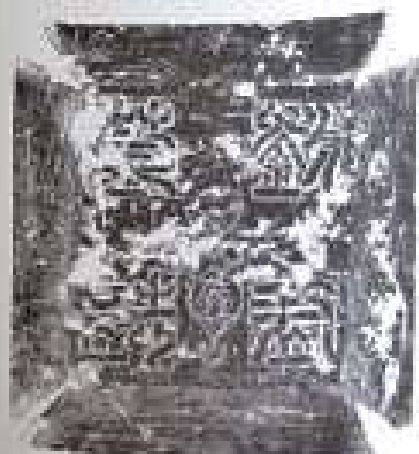
(一七) 大正改題重刊墓誌銘并序(并圖)