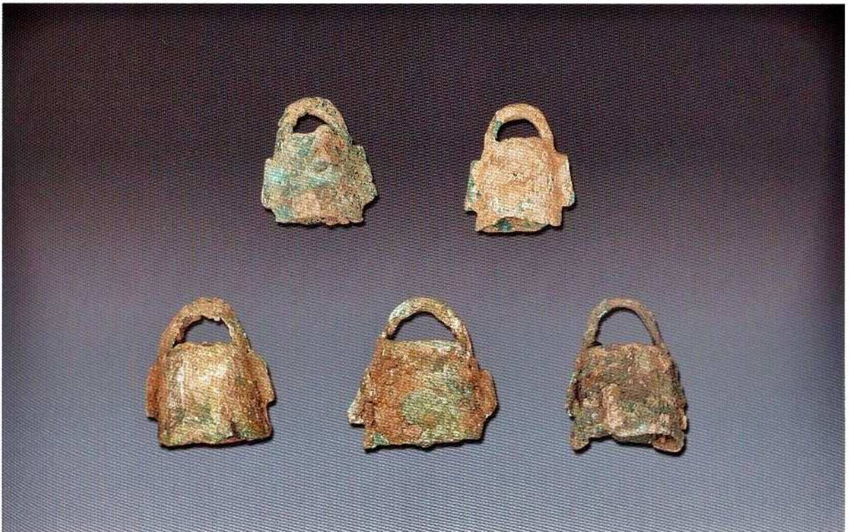
2. 上排：左：1b式铃 (M139 : 14)，右：1b式铃 (M139 : 15)；下排：左：1a式铃 (M139 : 5)，中：1a式铃 (M139 : 12)，右：1a式铃 (M12 : 14)