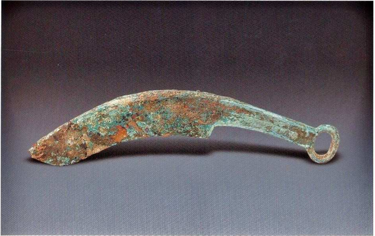
1. 铜刀 (M265 : 3)