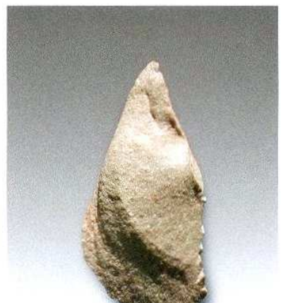
9. 微型石片H209② : 29