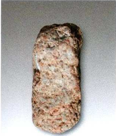
1. 石锤H209② : 14