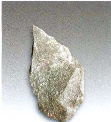
5. 微型石片H209② : 28