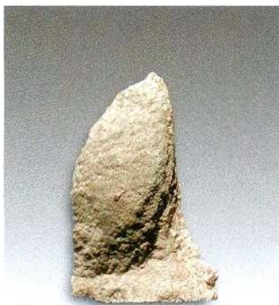
8. 微型石片H209① : 35