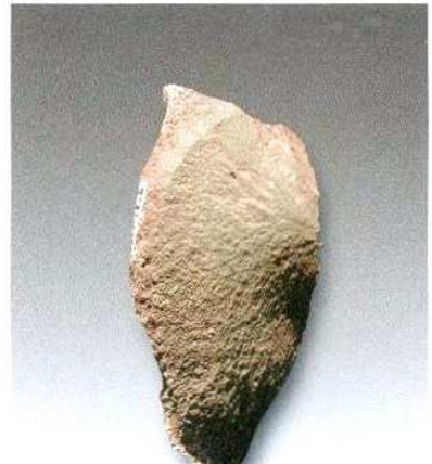
6. 微型石片H209③ : 30