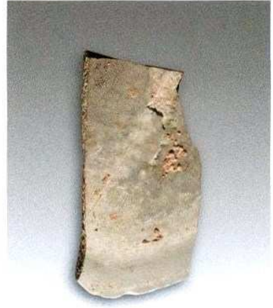
3. 石铲H209③ : 31