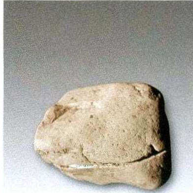
2. 石锤H209② : 24