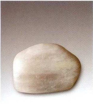
4. 打磨/抛光石器H209④ : 3