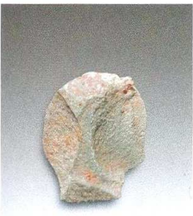
7. 微型石片H209③ : 34