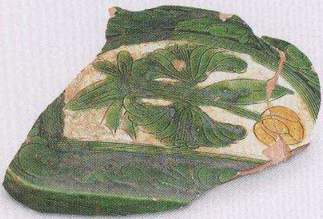
腰圆形三彩枕 (T2 ④ : 20)