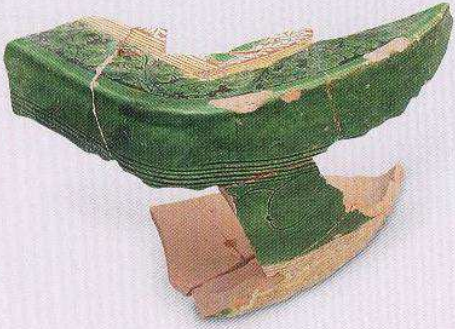
三彩枕 (T13 ③b : 24)