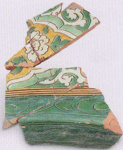
三彩枕 (T8 ④ : 55)