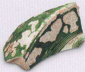
三彩枕 (T2 ④ : 18)