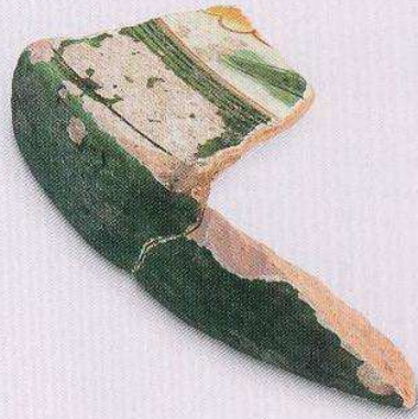
腰圆形三彩枕 (T04 F01 : 7)