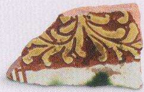
三彩枕 (T50 ④ : 37)