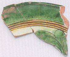
腰圆形三彩枕 (T50 ⑤ : 7)