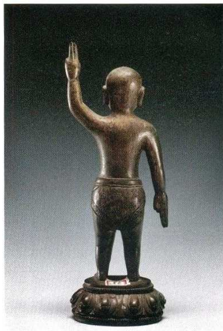
91 铜释迦牟尼佛诞生像