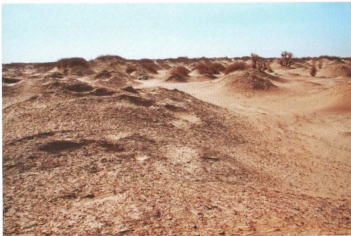
喀拉喀得干佛寺全景