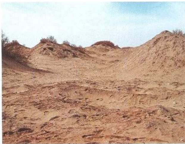
喀拉喀得干佛寺局部（东→西）

佛寺面积约6万平方米。遗址被严重盗掘，面目全非。遗址地表散落大量灰陶片、红陶片、铁渣、石磨残片、铜钱残片，还有壁画和陶质佛像残片，采集到陶质小佛头、莲花叶。