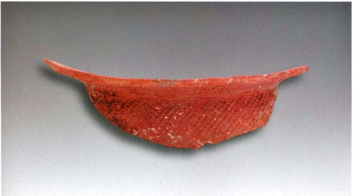
3. 夹砂陶盆形鼎 (XXM1DD)