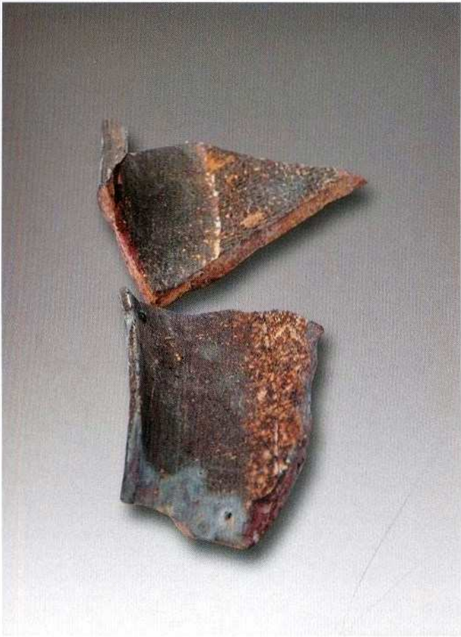
1. 印纹硬陶器 (XXM1DD)