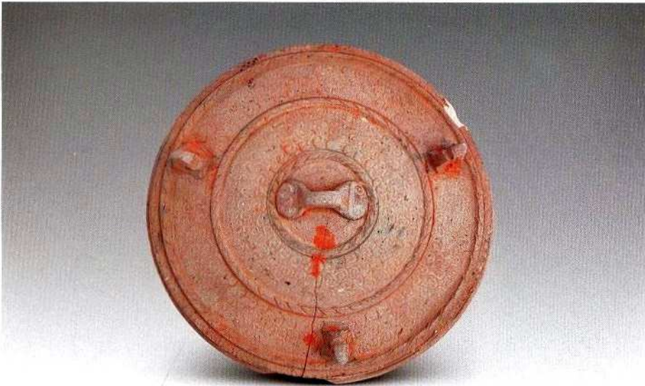
2. B型原始瓷器盖 (CZM1: 14)