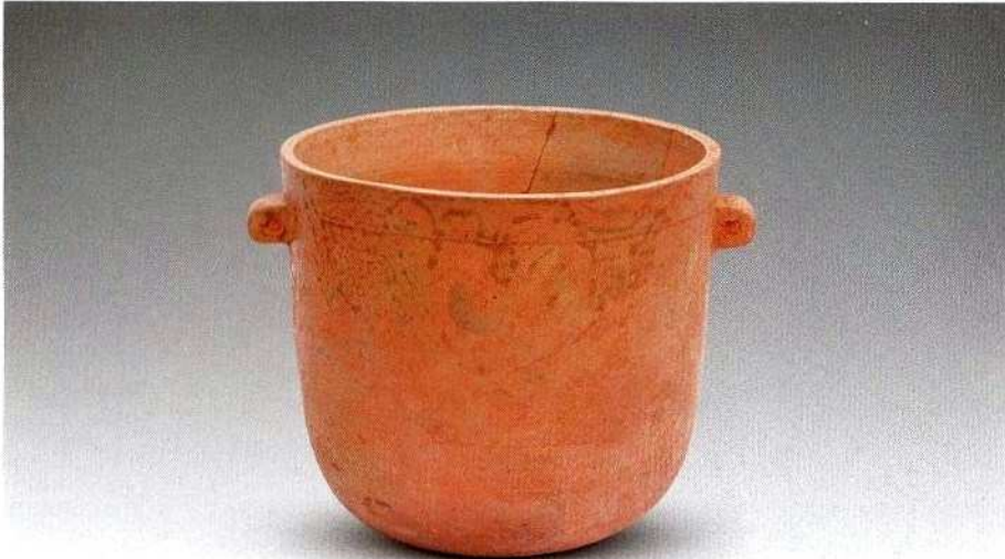
1. II式原始瓷甑 (CZM1: 27)