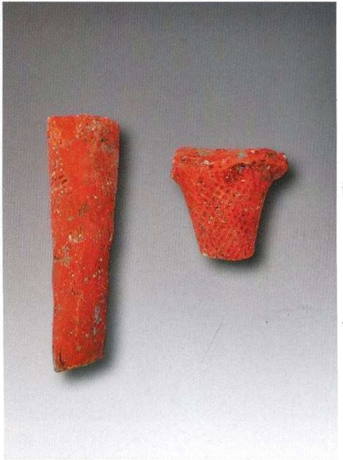
2. 夹砂陶鼎足 (XXM1DD)