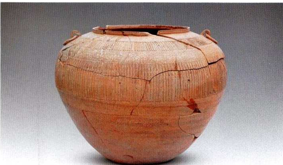
3. B型原始瓷罐 (直口双耳罐CZM1: 11)