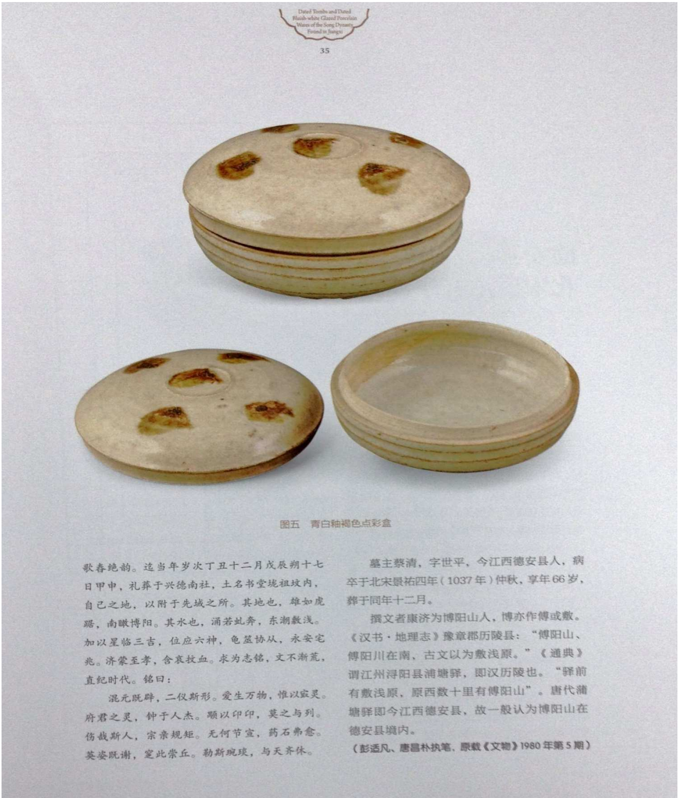
图五 青白釉褐色点彩盒

歌春绝韵。适当年岁次丁丑十二月戊辰朔十七日甲申，礼葬于兴德南社，土名书堂垅祖坟内，自己之地，以附于先域之所。其地也，雄如虎踞，南瞰博阳。其水也，涌若虬奔，东潮敷浅。加以星临三吉，位应六神，龟筮协从，永安宅兆。济蒙至孝，含哀投血。求为志铭，文不渐荒，直纪时代。铭曰：