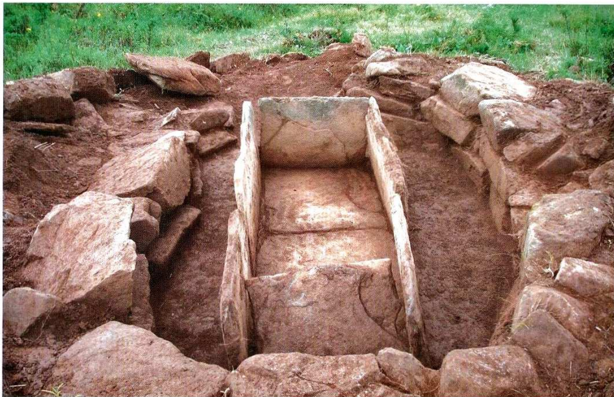
图版五六 达莱沟5号墓墓室内部石棺