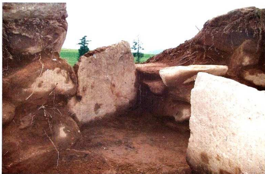
图版五七 达莱沟5号墓墓道及墓口封堵状况