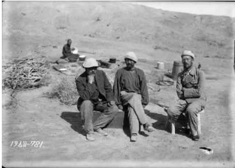
杜金、奧登堡、斯米爾諾夫等人1909年於吐魯番考察時拍攝。

《俄藏龜茲藝術品》所收內容為1905年俄羅斯別列佐夫斯基考察隊、1909年奧登堡考察隊在新疆庫車探險考察所獲壁畫、雕塑、工藝品等等，現藏於俄羅斯埃爾米塔什博物館，是為僅次於德國的大宗收藏。本書收入文物圖版262件，包括壁畫、雕塑、建築構件、錢幣等各個方面。俄國考察隊的筆記、考察臨摹圖和探險隊照片等資料，更是考察的第一手材料。