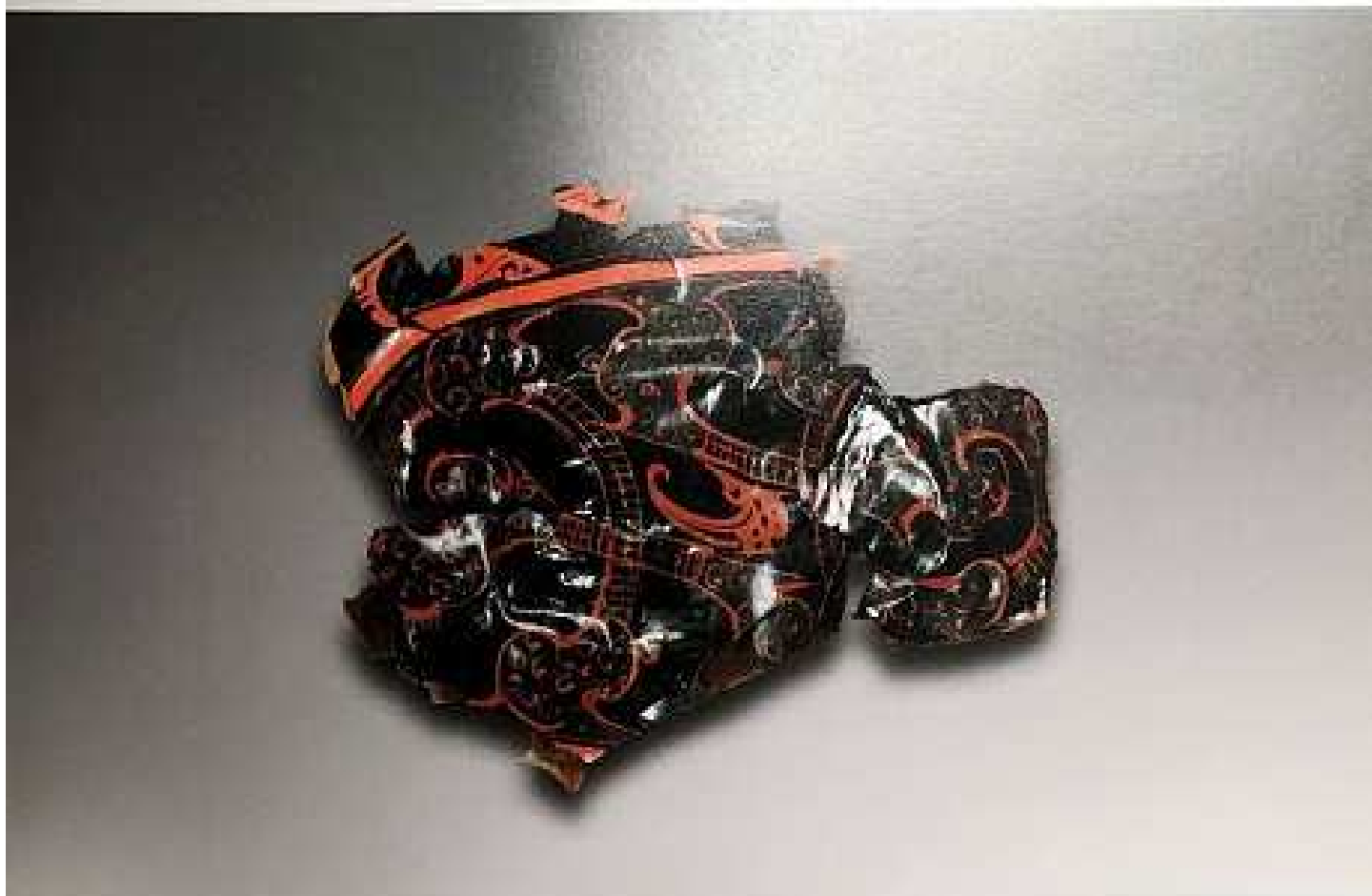
七六 漆耳杯 (MNX : 105)