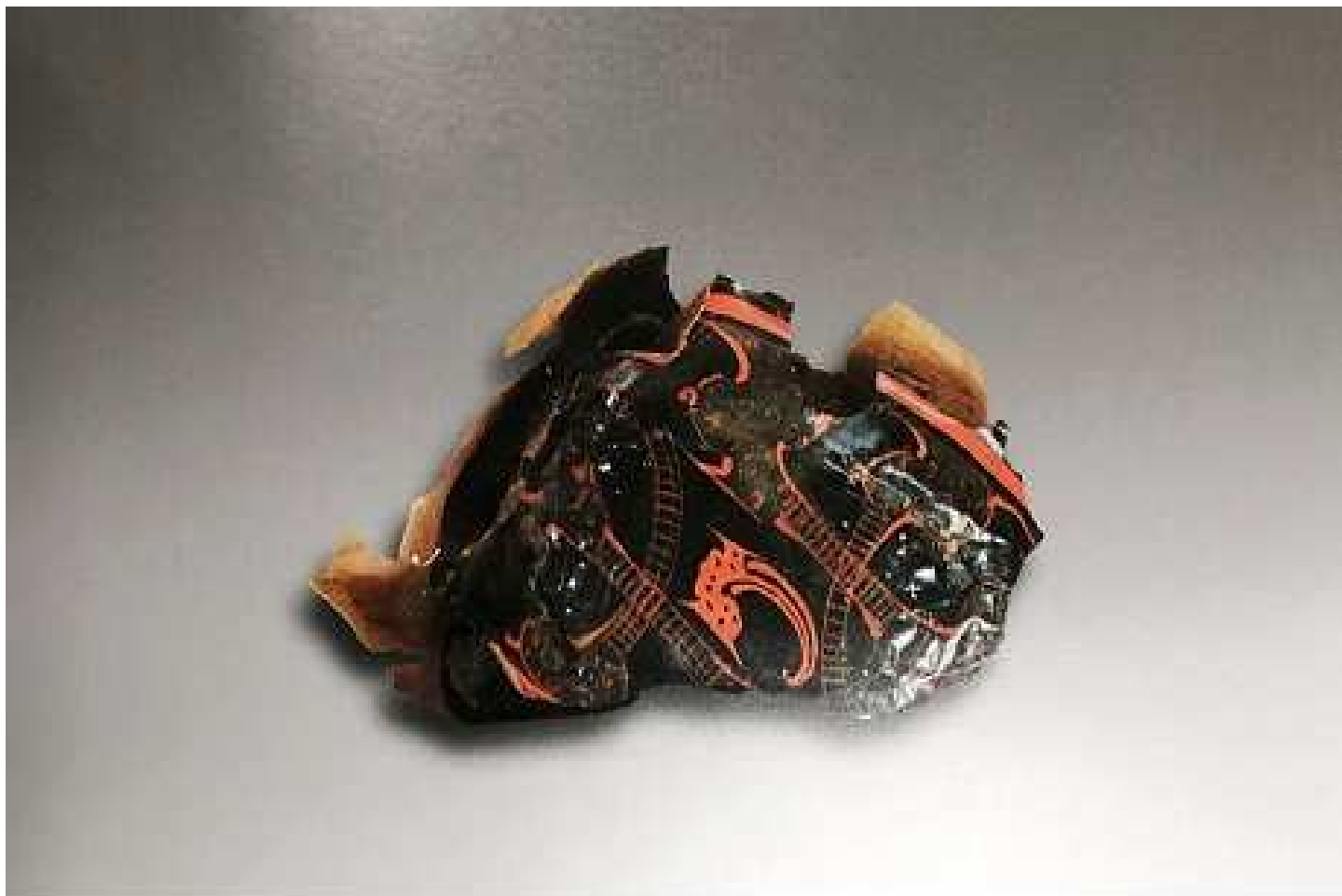
七五 漆耳杯 (MNX : 101)