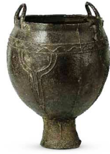
155 铜 Kovči na nožnane Cauldron with circular foot