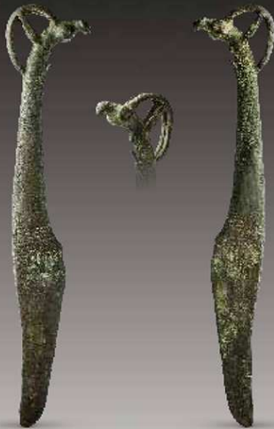
58 刀 Нож Knife