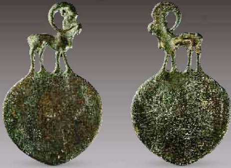
343 镜 Зерцало Mirror with handle