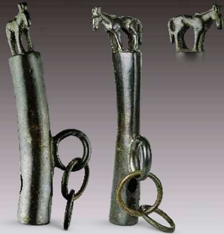
315 杆头饰 Нащупне Staff finial