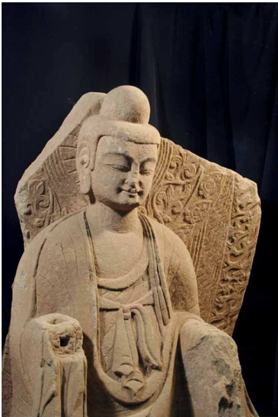
彩版六一 单体造像（QN四三八）